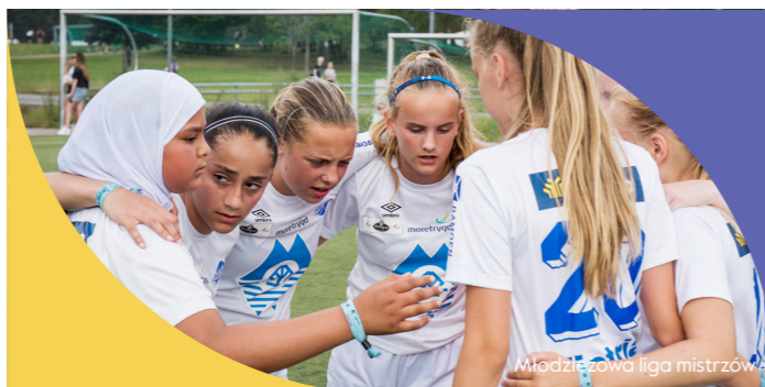
Młodzieżowa liga mistrzów

nauczycielka języka polskiego w Szkole MIKRON w Łodzi i terapeutka z zakresu terapii pedagogicznej. Pomysłodawczyni i koordynatorka Konkursu Filmowego „Lektury w kadrze” oraz Ogólnopolskiego Konkursu Plastycznego „Baśnie, naturalnie!”. Inicjatorka projektów realizowanych za pośrednictwem platformy eTwinning: „Stworzeni z wyobraźni”, „Usłysz legendę”, „Tęczowa gramatyka” oraz innych projektów rozwijających umiejętności językowe uczniów. Członkini grupy Superbelfrzy, ambasadorka programu eTwinning, współzałożycielka ogólnopolskiej sieci współpracy nauczycieli Mozaika Edukacyjna. Autorka bloga „Zakrecony belfer” www.zakreconybelfer.pl