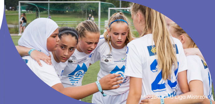
Młodzieżowa Liga Mistrzów