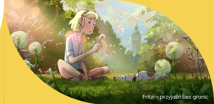
Fritzi – przyjaźń bez granic