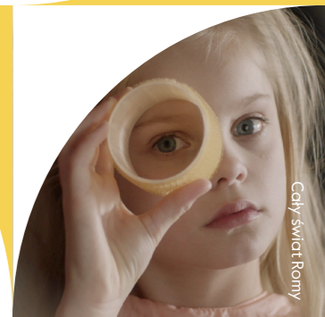
Cały świat Romy