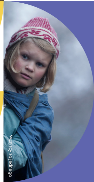
Wszyscy za jednego