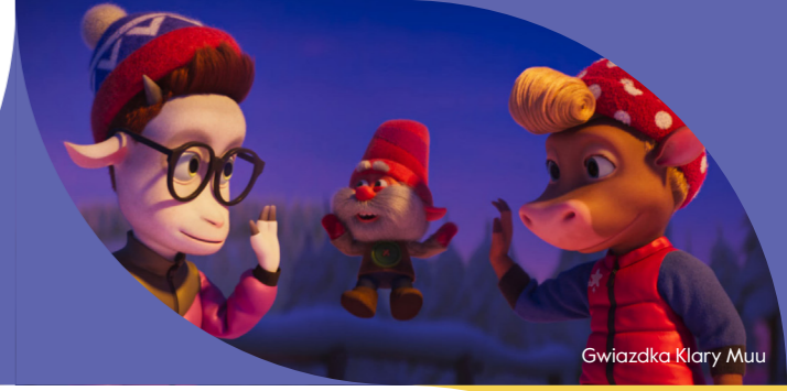
Gwiazdka Klary Muu