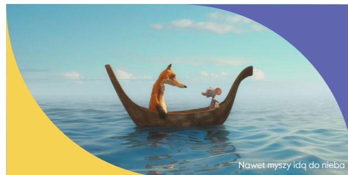
Nawet myszy idą do nieba

nauczycielka edukacji wczesnoszkolnej i języka polskiego; pedagog terapeuta; dyrektor do spraw pedagogicznych w Dwujęzycznej Szkole Podstawowej im. A. Einsteina w Warszawie; autorka podręczników do edukacji przedszkolnej i wczesnoszkolnej, terapii pedagogicznej oraz scenariuszy lekcji w ramach edukacji filmowej; konsultantka metodyczna programów edukacyjnych.