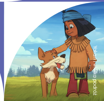
Yakari i miszka podróż